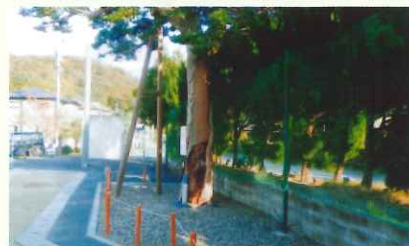
巨樹・老樹・名木の保存（備前市吉永小学校）