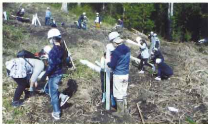
子供たちによる植樹活動（津山市 加茂小）