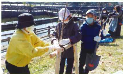
県民による公園の緑化（倉敷市酒津公園）