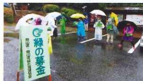
みどりの少年隊による募金活動