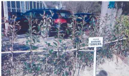
公園・学校など公共施設の緑化（和気町）