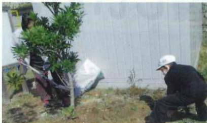
公園・学校など公共施設の緑化（総社市）