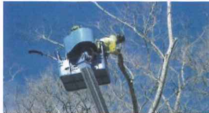
巨樹・老樹・名木の保存(総社市 作原の棕の古木)