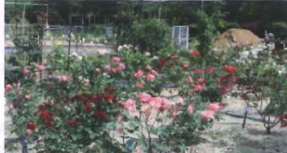
市民団体による公園整備 (井原市)