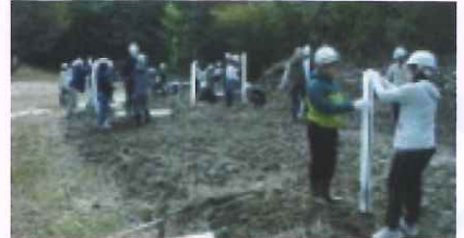
子供たちによる植樹(津山市 加茂小)