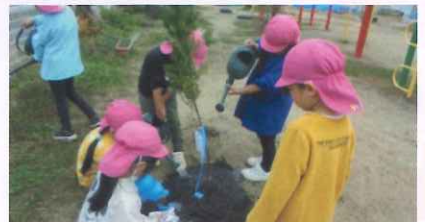
公園・学校など公共施設の緑化(美作市)