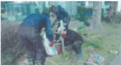
公園・学校など公共施設の緑化(備前市)