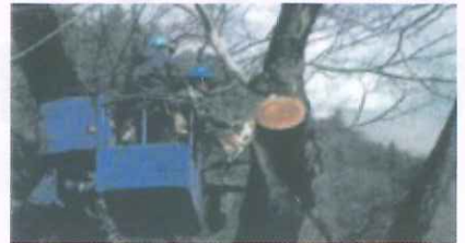
巨樹・老樹・名木の保存(美作市 横川のムクノキ)