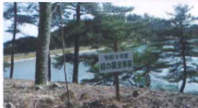
公園・学校など公共施設の緑化(高梁市)