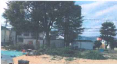
学校環境緑化 (矢掛町 矢掛小)