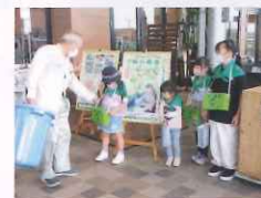
みどりの少年隊による募金活動