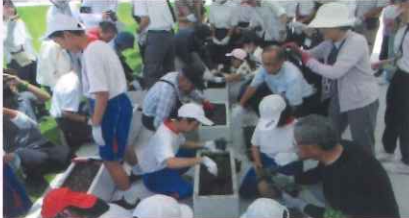
市民による公園の緑化(倉敷市まびふれあい公園)